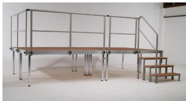
Bühne mit Geländer und Aufgangstreppe