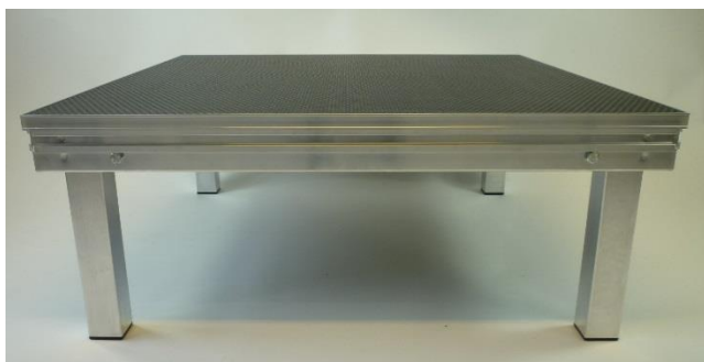
Bühnenelement Praktikus light