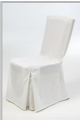
Front (mit Falte)