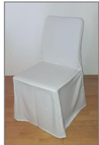
schlicht (z.B. für Evosa)