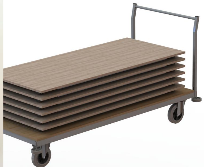
Tischtransportwagen HSW zur liegenden Lagerung von HS-Konferenzklapptischen

F: Aluminium-T-Schiene zur Stabilisierung der Tischplatte (sofern bestellt)