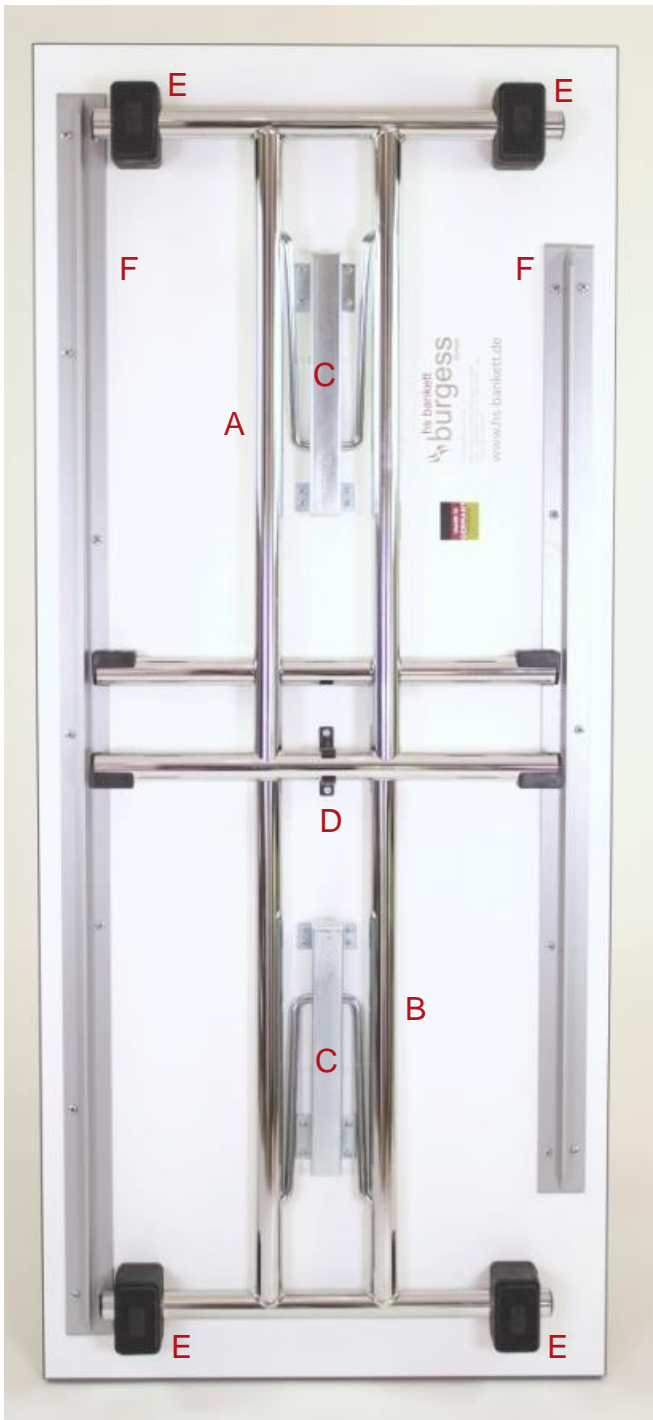
HS-Konferenzklapptisch mit T-Beschlag doppelsäulig

Um eine dauerhaft sichere Verwendung und eine lange Lebensdauer zu gewährleisten, sind die HS-Konferenzklapptische stets sachgemäß zu nutzen und pfleglich zu behandeln.