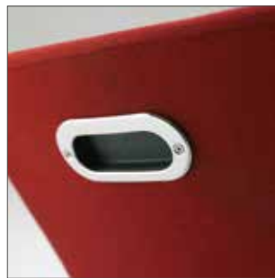
Optional: integrierte Griffmulde