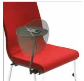
Optional: abnehmbare Schreibplatte