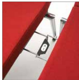
Optional: ausziehbare Reihenverbindung mit und ohne Nummerierung