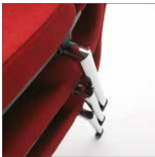
Erhöhte Stabilität der Stuhlstapel