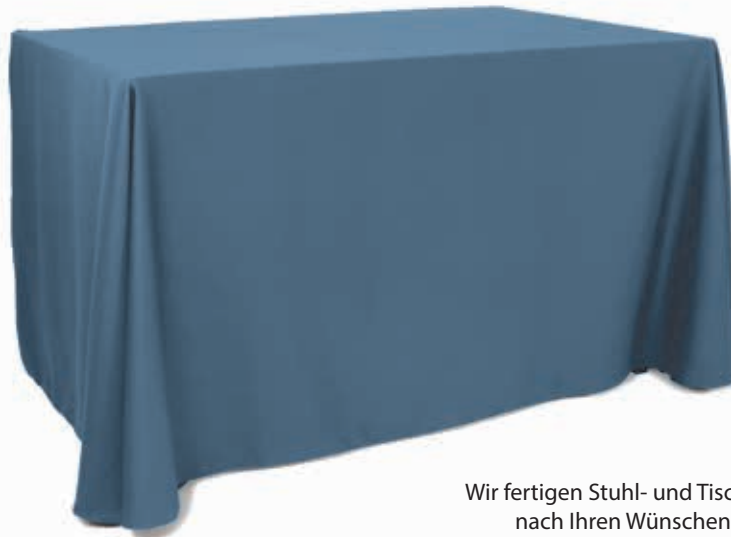
Tischhülle Variante 1