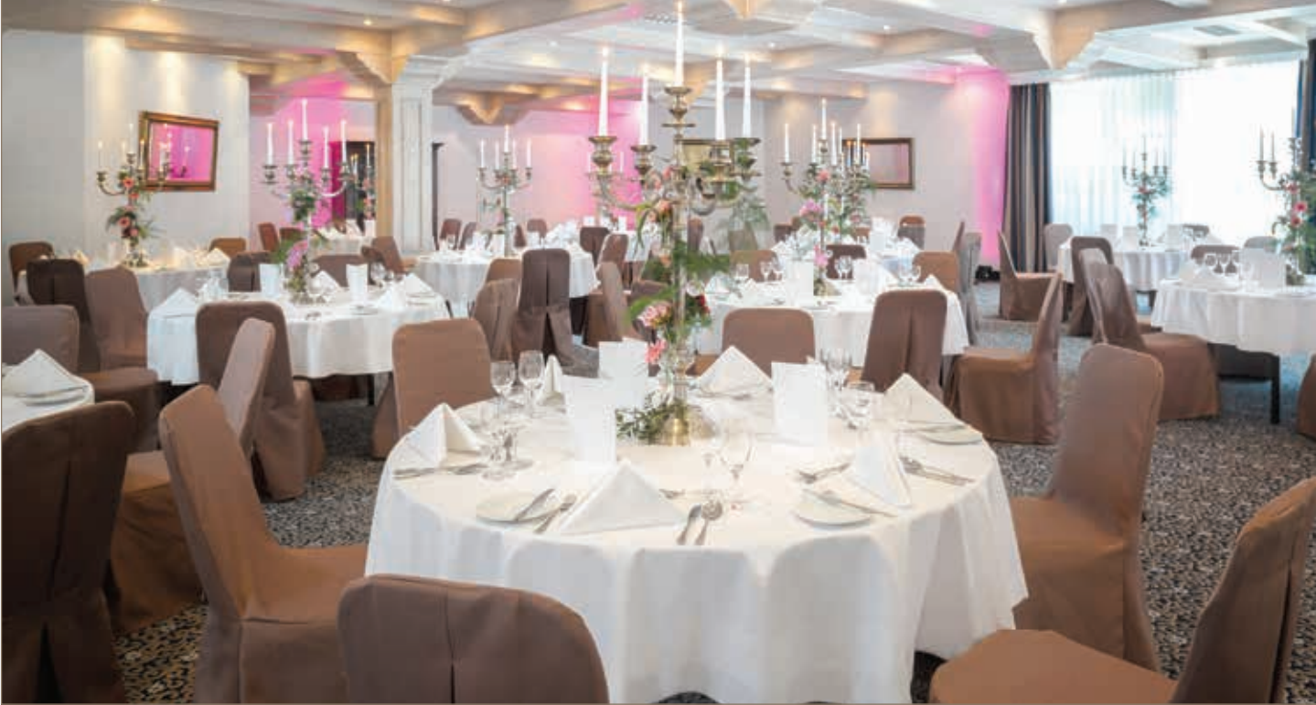
Dorint Sporthotel, Garmisch-Partenkirchen, Festsaal Neuschwanstein