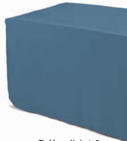
Tischhülle Variante 2